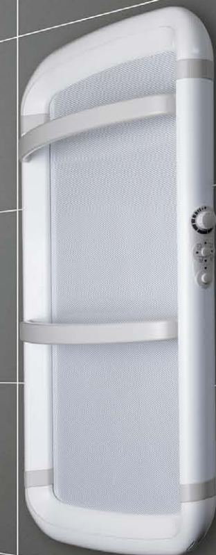
ACANTO 70 230 V/50 Hz - 300W Ideale per bagni fino a 4 m 2 Barre porta-salviette: 2 Misura in cm: 71 x 52 x 16,5 (massima distanza dal muro) Versione bianca