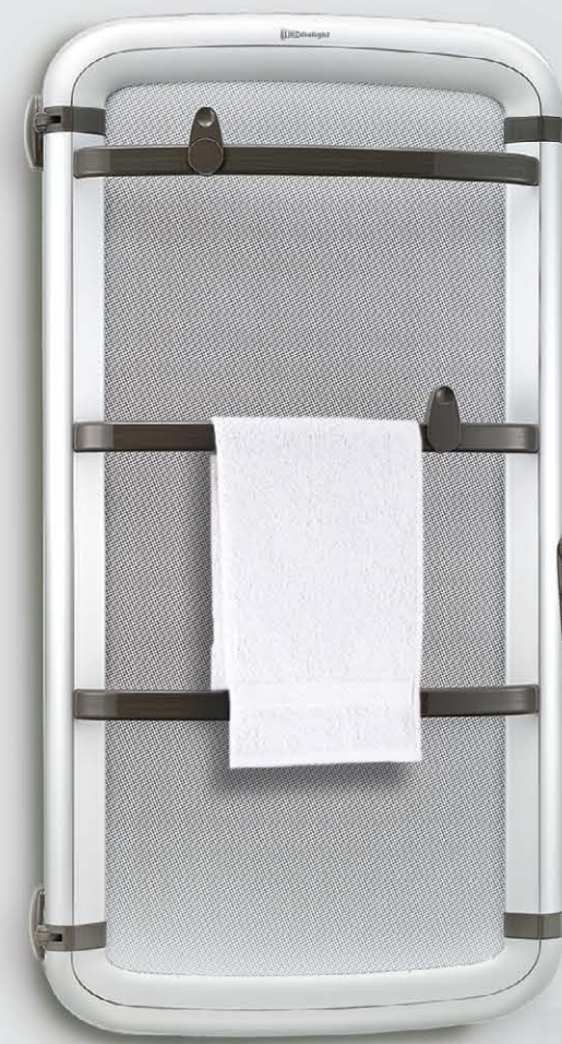
HELISEA 110 230 V/50 Hz - 450W Ideale per bagni fino a 6 m 2 Barre porta-salviette: 6 (3 + 3) + 2 ganci porta-accappatoi Misura in cm: 101 x 52 x 16,5 (massima distanza dal muro) Versione alluminio